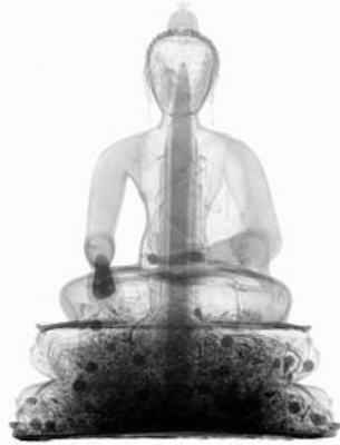
Bild mit einer Neutronenquelle erzeugt.