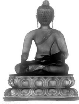
Bild mit einer Röntgenquelle erzeugt.

Das Neutronenbild zeigt, dass in der Statue Holzgegenstände und trockene Blumen verborgen sind. Die Statue blieb bei der Untersuchung völlig unbeschädigt; Röntgenstrahlen hätten keinen Blick ins Innere der Staute ermöglicht.